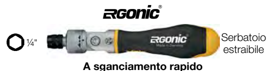
A sganciamento rapido