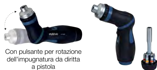
Con pulsante per rotazione dell'impugnatura da dritta a pistola